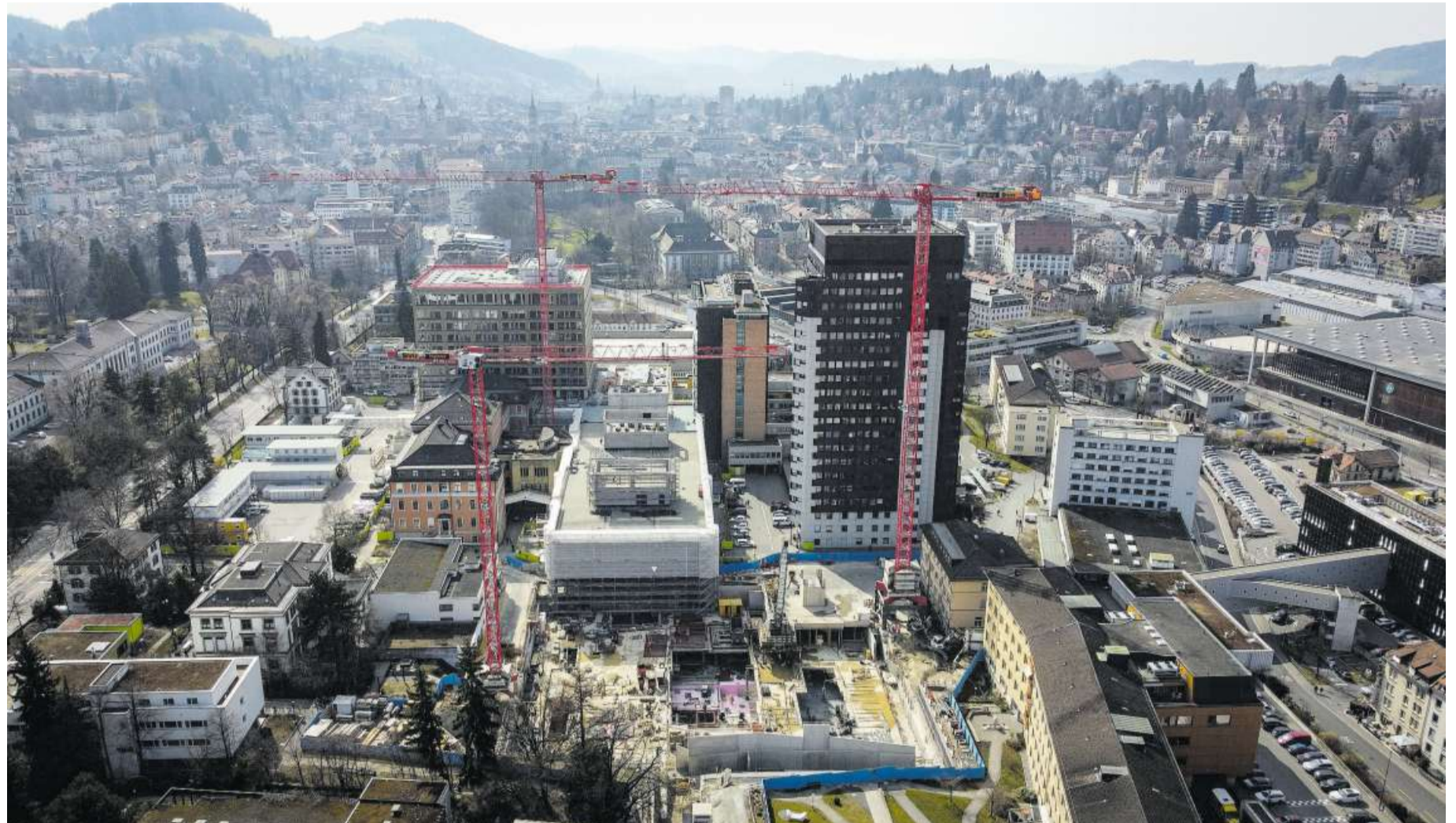
Grossbaustelle St. Galler Kantonsspitalareal: Im Ensemble mit dem neuen Bettenturm (hinten links) ist etwa dort, wo der Kran vorne steht, ein zusätzliches Hochhaus mit direkter Verbindung zum neuen Kinderspital geplant. (St. Gallen, 21. März 2022)

Dieselbe Kritik bekräftigt der BWA Ostschweiz als Beob-