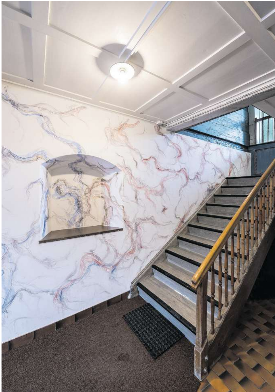
Wandfüllendes Fresko «Triade» von Vera Marke im Wirtshaus zur Krone in Hundwil.